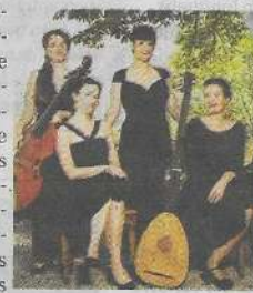
Avec Les Kapsber'Girls en l'Eglise de Xaintraillles.

Les Kapsber'girls offrent une redécouverte des quatre premiers livres de villanelles du Tedesco, comme on le surnommait, au travers d'une interprétation unique. A ces œuvres vocales remarquables viendront