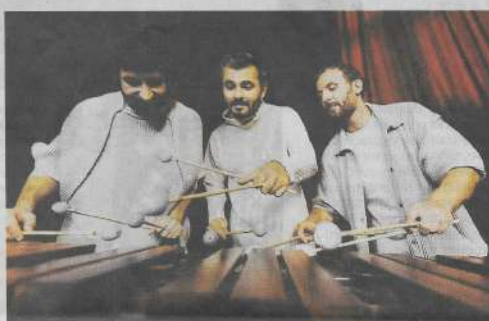
Le trio SR9. Photo festival de musique.

La percussion est l'une des formes les plus anciennes et les plus fondamentales de production de sons dans la musique. Elle est présente dans presque toutes les civilisations du monde et remonte à des milliers d'années.