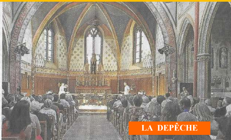
Un public au rendez-vous. Photo musique en Albret

Plusieurs siècles après, autre musicien français, Satie et une de ses gymnopédies : et là encore, le charme opère parfaitement. On croirait les gymnopédies écrites pour marimba. Même le John Adams qui suit reste mélodieux, quoique plus sombre et percussif les subtiles répétitions chères à Adams se fondant dans les vibrations des instruments. Étonnant ! Quant à Lily Boulanger, sa subtile musique est métamorphosée et magnifiée par l'ajout de pinces et d'une plaquée d'aluminium pour faire la résonner d'un son nou-