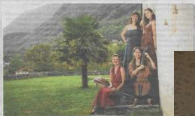
La complicité des artistes, leur sens talents des compositeurs, permet un concert de qualité dans l'église de Xaintraillles. Les Kapsber'girls ont joué leur « Che fai tu » à l'église de Xaintraillles.