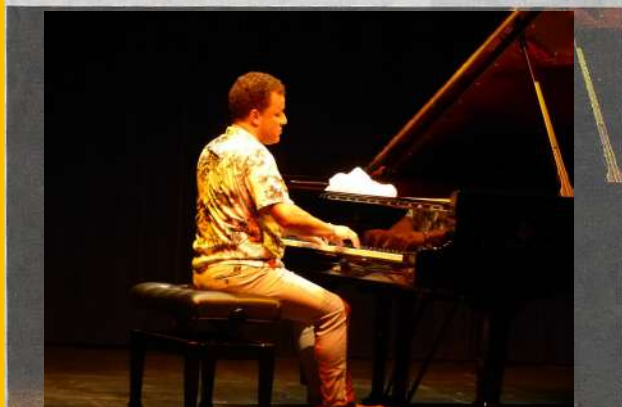
Jacky Terrasson.

Le Festival de musique en Albret a mis à l'honneur le piano au théâtre de Barbaste mardi dernier en proposant un concert de musique classique, puis un concert doublé de piano jazz.