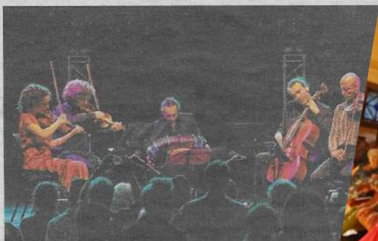
Le concert est programmé vendredi, à 20 heures, au temple. FESTIVAL DE MUSIQUE EN ALBRET

Dans ces « Figures Argentines », les artistes mêlent œuvres originales, créations et relectures de thèmes traditionnels. Un programme qui se veut festif, offrant un panel des musiques folkloriques argentines les plus évocatrices. Des tangos bien